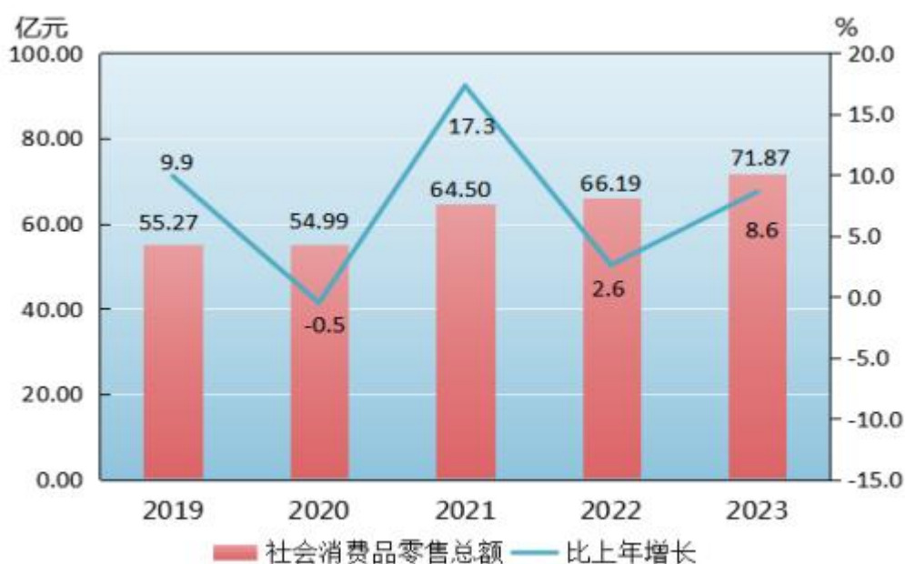
图 4 2019-2023 年社会消费品零售总额及其增长速度

限额以上消费品零售额 14.89 亿元，增长 10.4%。限额以上批零住餐业销售（营业）额 51.09 亿元，增长 16.8%。其中，限上批发业商品销售额 37.94 亿元，增长 17.4%；限上零售业商品销售额 8.14 亿元，增长 25.6%；限上住宿业营业额 1.97 亿元，下降 23.7%；限上餐饮业营业额 3.04 亿元，增长 28.2%。